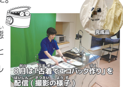
8月は「古着でエコバッグ作り」を配信(撮影の様子)

ふなばし三番瀬環境学習館は、どんな時でも、“好奇心”と“もっと知りたいという気持ち”を大切に様々な工夫で学びの場を提供していきます。皆さんが安心して楽しく学べる日が早く来ますように。(久永)