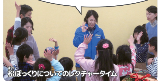
松ぼっくりについてのレクチャータイム

松ぼっくりの中には、羽根が付いた種があります。その種を高いところから落とすとくるくる回りながらゆっくりと落ちます。さあ、この羽根の付いた種を空中に上げてみましょう!